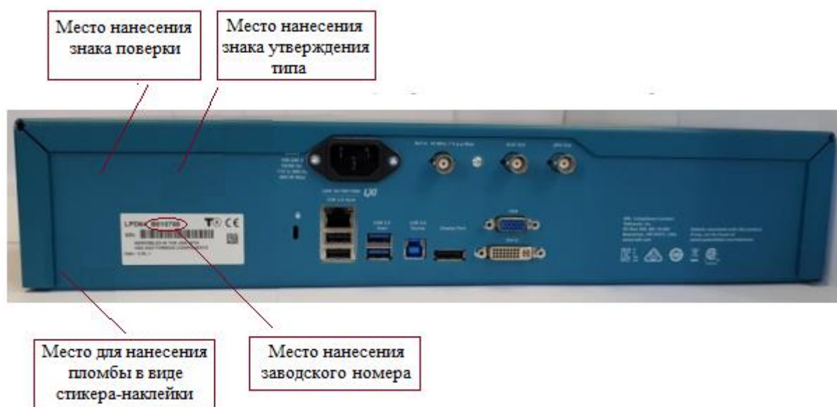
Рисунок 1. Общий вид средства измерений с указанием мест пломбировки (для стикера-наклейки), мест нанесения знака утверждения типа, знака поверки, заводского номера

Нанесение знака поверки на средство измерений не предусмотрено. Заводской номер в виде цифро-буквенного обозначения, состоящего из арабских цифр и букв латинского алфавита, наносится ударным способом на табличку в месте, указанном на рисунке 1.